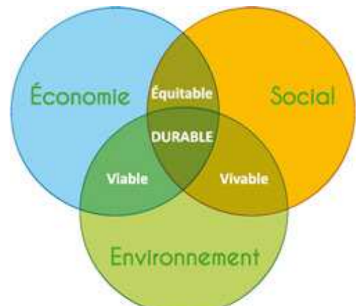
Les 3 piliers du Développement Durable